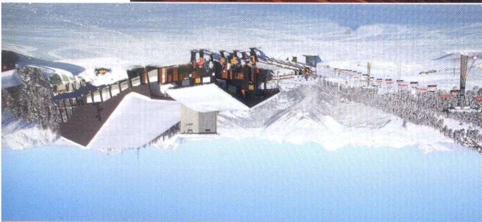
Sopra e a fronte, la conca di Pila si raggiunge con una telecabina dall'uscita Aosta dell'autostrada: 90 minuti in auto da Milano, 60 da Torino. A sinistra, la vetrata dell'hotel Maison de Neige a La Thuile. Sotto, snowkite a Vetan e l'hotel Principe delle Nevj di Breuil-Cervinia.